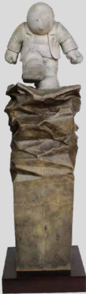
(1) GRAN EGO 2012 297 X 93 X 75 CM BRONCE