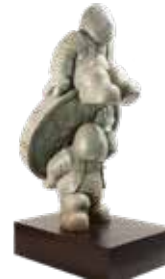
(6)LOS DE ARRIBA Y LOS DE ABAJO