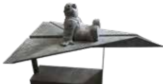
(9)AVIÓN DE PAPEL