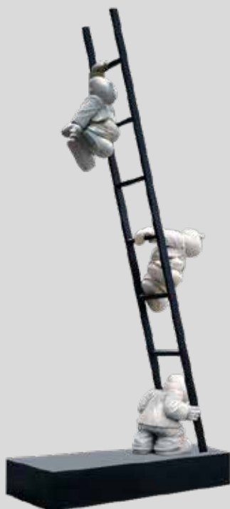
(12) BUSCANDO EL EQUILIBRIO 2016 600 X 250 X 110 CM BRONCE Y PERFIL METÁLICO