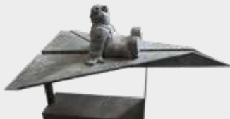
(9) AVIÓN DE PAPEL