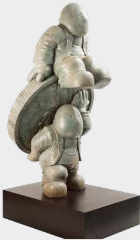
(6) LOS DE ARRIBA Y LOS DE ABAJO 2013 200 X 87 X 100 CM BRONCE