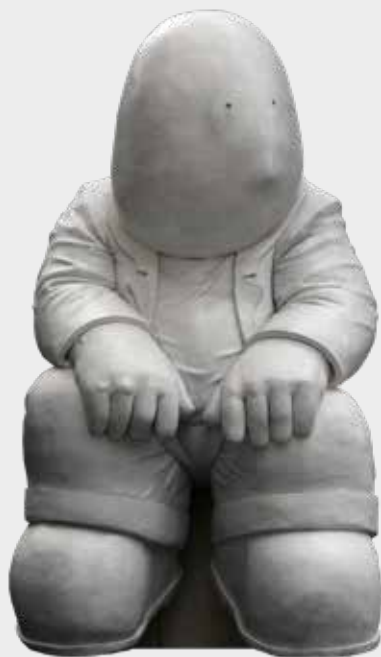
(10) EL VIGILANTE 2015 470 X 230 X 200 CM RESINA