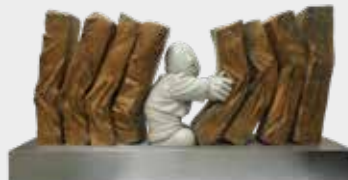
(11) NUEVE BLOQUES