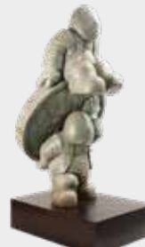
(6) LOS DE ARRIBA Y LOS DE ABAJO