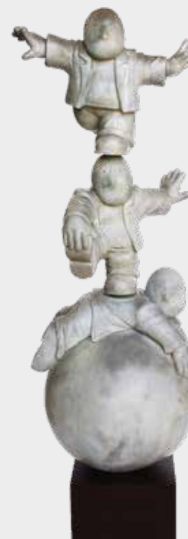
(13) BAJO CONTROL 2010 300 X 90 X 90 CM BRONCE Y FIERRO