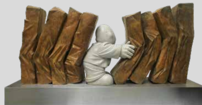
(11) NUEVE BLOQUES 2016 87 X 167 X 43 CM BRONCE Y ACERO INOXIDABLE