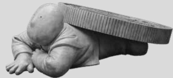
(7) UNITED STATES ON AMERICA 2014 46 X 89 X 146 CM BRONCE