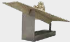
(2) EL PILOTO