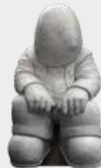
(10) EL VIGILANTE